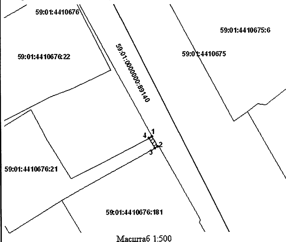
Каталог координат (Система координат МСК-59)

Категория земель: земли населенных пунктов.